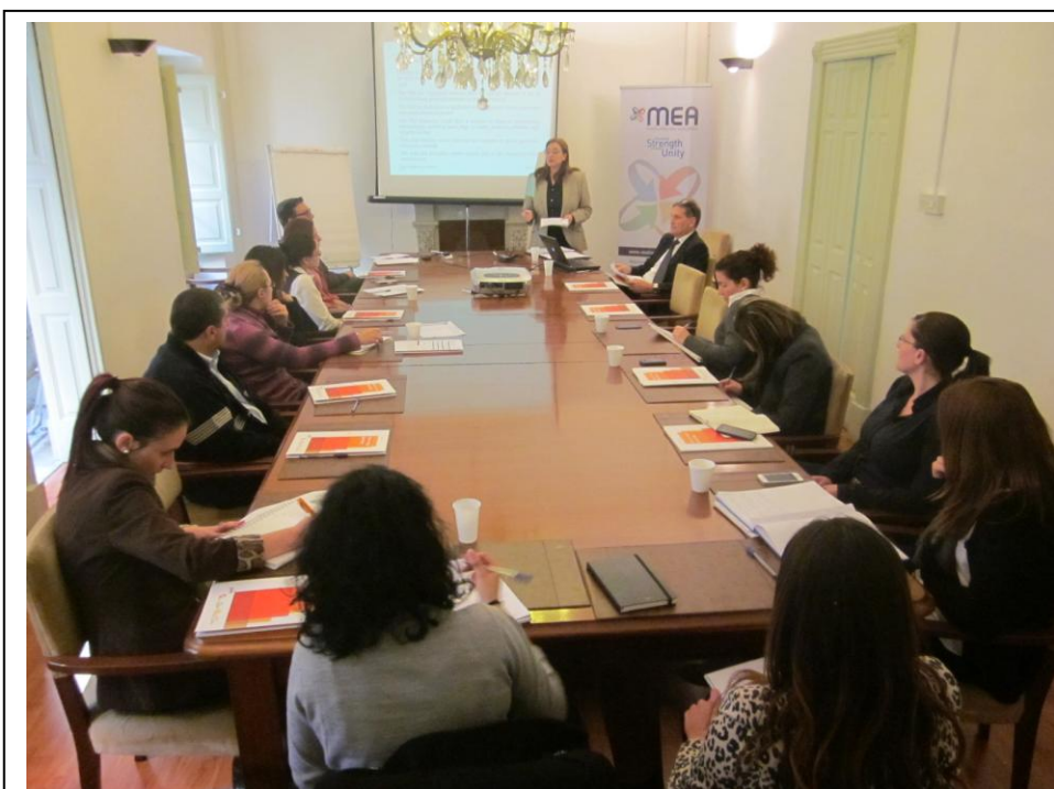
Course: Employment - Fiscal and Practical Considerations

Dan tistgħu tagħmluh billi, tibghatu email fuq anton.vella@maltaemployers.com jew admin@maltaemployers.com